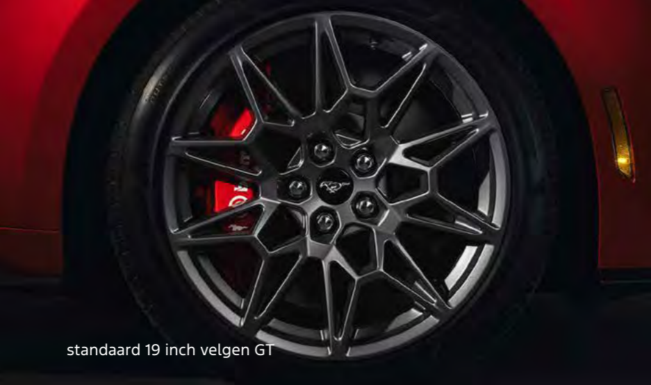
standaard 19 inch velgen GT