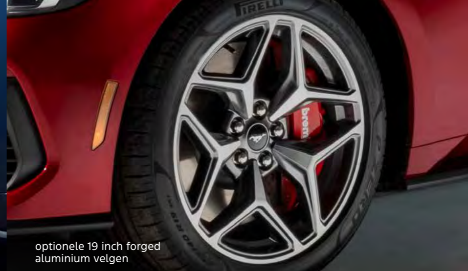
optionele 19 inch forged aluminium velgen