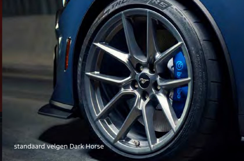
standaard velgen Dark Horse