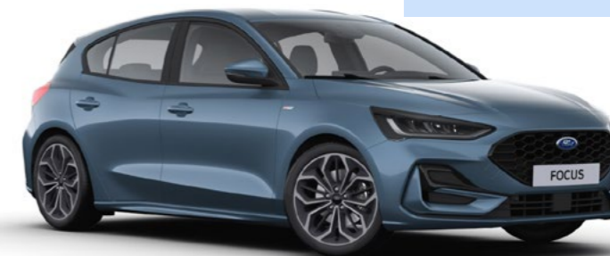
Premium metaallak Chrome Blue