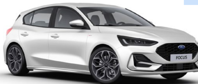
Unilak Frozen White