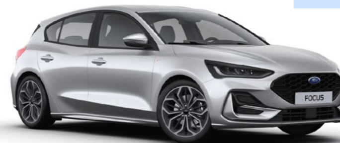
Metaallak Moondust Silver