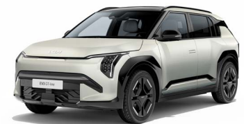
Ivory Silver Mat Kleurcode: ISM