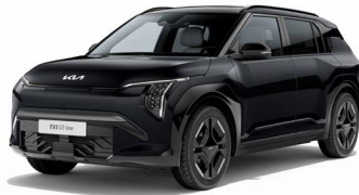
Aurora Black Pearl Kleurcode: ABP