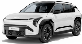
Clear White (solid) Kleurcode: UD

Kleuren beschikbaar voor alle uitvoeringen