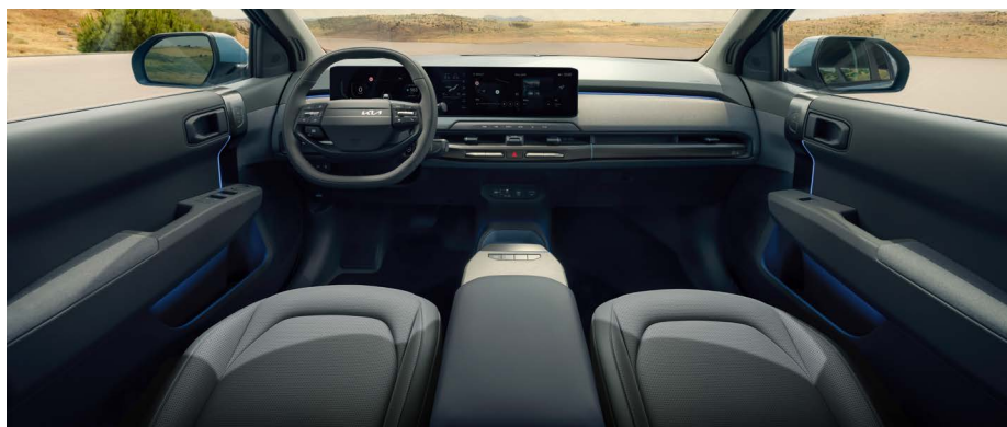
Vegan lederen bekleding - two-tone grijs

Vegan lederen stoelbekleding in een combinatie van lichtgrijs en donkergrijs. De middenconsole en de stoelbekleding beschikken over lichtblauwe accenten. Het dashboard, de deurpanelen en -armsteunen zijn voorzien van stoffen bekleding.