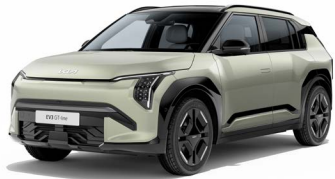
Aventurine Green Kleurcode: AG3