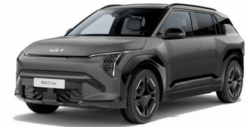
Shale Grey Kleurcode: EBD