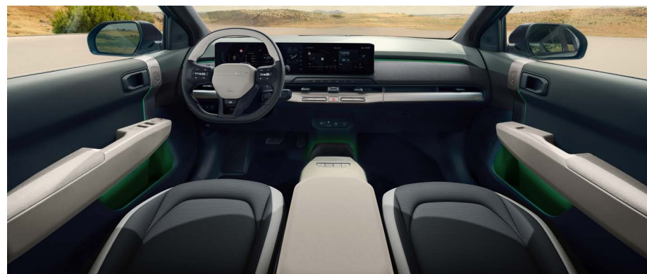
Vegan lederen bekleding - two-tone gebroken wit/grijs

Vegan lederen GT-Line stoelbekleding in een combinatie van gebroken wit en donkergrijs. Armsteunen in de deuren zijn voorzien van vegan leder en het dashboard en de deurpanelen zijn voorzien van stoffen bekleding. De hoofdsteunen zijn voorzien van mesh stof en de achterkant van de voorstoelen is aan de bovenzijde voorzien van een stoffen afwerking.