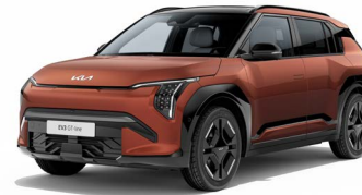
Terra Cotta Kleurcode: TCT