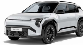
Snow White Pearl Kleurcode: SWP