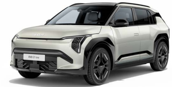
Ivory Silver Glossy Kleurcode: ISG