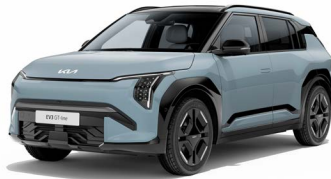
Frost Blue (solid) Kleurcode: EBB