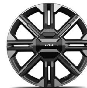
20" lichtmetalen velgen (255/45 R20) Standaard voor GT-Line