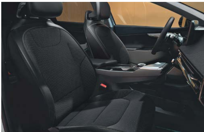
Stof/vegan leder combinatie

Stoelzitting in donkergrijs met subtiel reliëf, het bovenste gedeelte van de rugleuning en hoofdsteun afgewerkt in het zwart. Dashboard met duurzame materialen en in donkergrijze tinten.