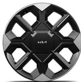
20" lichtmetalen velgen (255/45 R20) Standaard voor Plus 84kWh en Plus Advanced