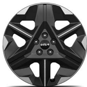
19" lichtmetalen velgen (235/55 R19) Standaard voor Light Edition, Air en Plus 63kWh