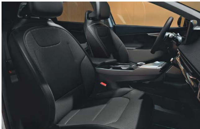
Vegan lederen bekleding - zwart

Stoelzitting in zwart met gewatteerde horizontale afwerking, het bovenste gedeelte van de rugleuning en hoofdsteun afgewerkt in het zwart. Dashboard met duurzame materialen en in donkergrijze tinten.