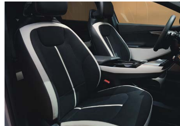
GT-Line design in suède/vegan leder combinatie - GT-Line

Stoelzitting in suède met vegan lederen inserts.