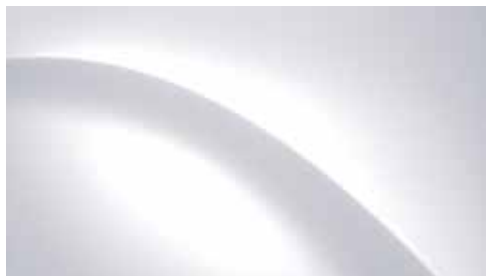
Creamy White Solid